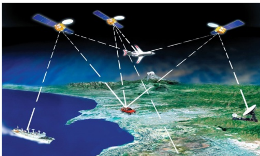
Рисунок 1. Позиционирование по сигналам глобальных навигационных спутниковых систем (ГНСС)

В настоящее время подавляюще большинство систем позиционирования по сигналам ГНСС производится иностранными компаниями или используют импортную элементную базу