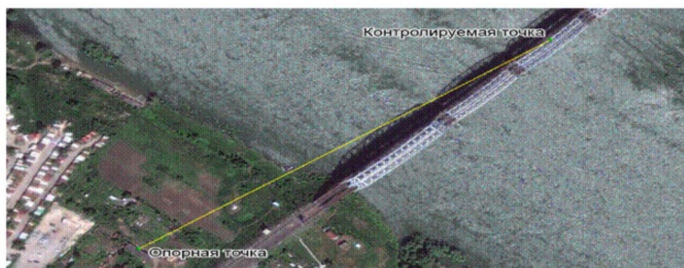
Рисунок 3. Эксплуатация системы на автомобильном мосту.

Система мониторинга инженерных сооружений (СМИС) в настоящее время эксплуатируется на ряде объектов, в том числе на автомобильном мосту через реку Обь в г. Новосибирске. Система СМИС является отечественной разработкой, не уступающей, а по точностным показателям превосходящей известные зарубежные аналоги. В ней используется оригинальное программное обеспечение и защищенные патентами технические решения.