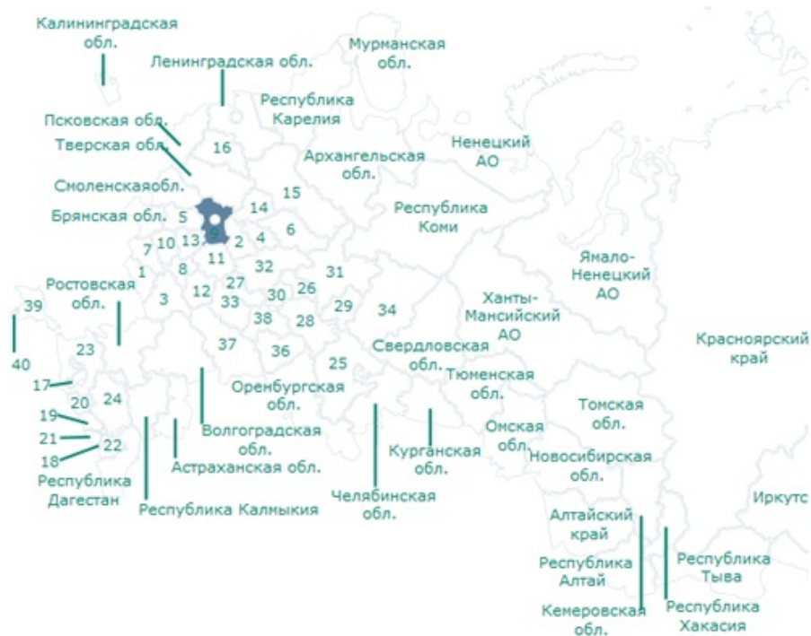
Рисунок 1 Карта — схема совершённых преступлений (Москва и МО)

Наименьшее количество преступлений зарегистрировано в районах Восточной Сибири, Дальнего Востока, Калининградской области, республики Крым, центральной России, где количество зарегистрированных случаев не превышает 2 143. (рисунок 2).