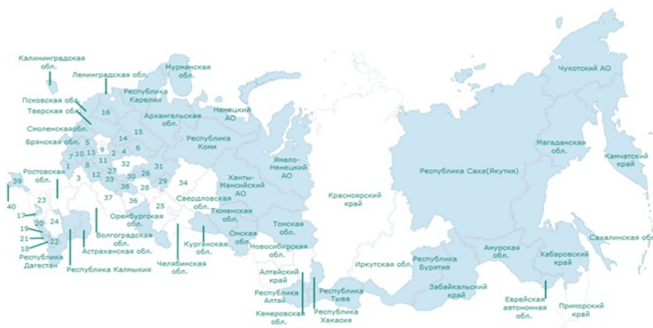
Рисунок 2 Карта — схема совершенных преступлений

Наименьшее количество преступлений зарегистрировано в районах Восточной Сибири, Дальнего Востока, Калининградской области, республики Крым, центральной России, где количество зарегистрированных случаев не превышает 2 143. (рисунок 2).