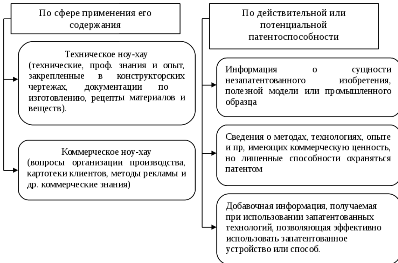
Рисунок 2 - Классификация ноу-хау по сфере применения его содержания и патентоспособности

Субъектами прав на ноу-хау могут быть только лица, осуществляющие предпринимательскую деятельность (в т.ч. НКО), а именно: юридические лица – организации и физические лица – индивидуальные предприниматели. Основные моменты «жизненного цикла» объектов ноу-хау (коммерческой тайны) рассмотрены на рисунке 3. Рассмотрим особенности бухгалтерского учета на каждом этапе жизненного цикла ноу-хау. Как видно из рисунка жизненный цикл объектов ноу-хау начинается с создания (появления) на предприятии. К юридическим основаниям приобретения статуса правообладателя ноу-хау можно отнести: