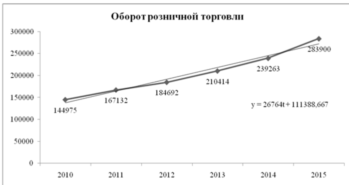
Рисунок 1 – Уравнение тренда для оборота розничной торговли

Эмпирические коэффициенты тренда a и b являются лишь оценками теоретических коэффициентов \beta_i , а само уравнение отражает лишь общую тенденцию в поведении рассматриваемой переменной.