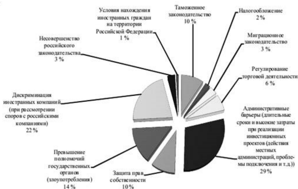
Рис. 1. Условия и факторы, влияющие на инвестиционную безопасность [6]

При реализации инвестиционных проектов необходимо учитывать ряд факторов, которые оказывают влияние на деятельность иностранных инвесторов на территории Российской Федерации (рис. 1).