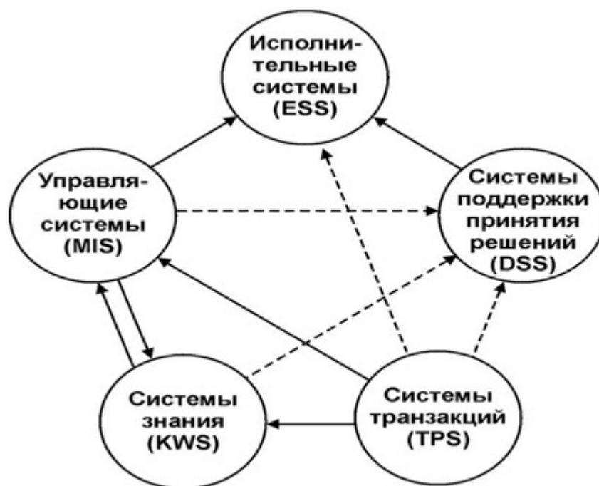
Рисунок 1 – Схема взаимодействия модулей информационной системы

Связь между DSS и модулями TPS, KWS, MIS являются неопределенной, так как чаще всего предприятия характеризуются средним или низким уровнем автоматизации процессов. Как правило, модуль DSS изолирован от основных производственных информационных систем, но использует их информационные потоки для работы своих аналитических систем. [4]