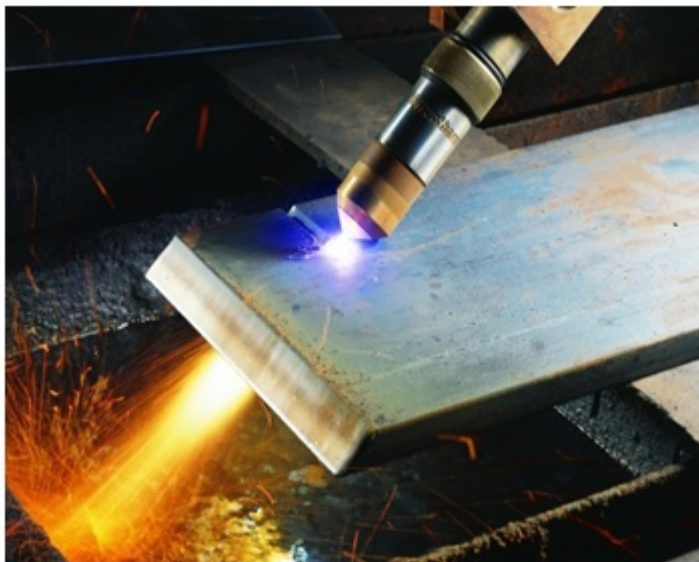
Рисунок 1 — Изменение угла резания плазмоторна