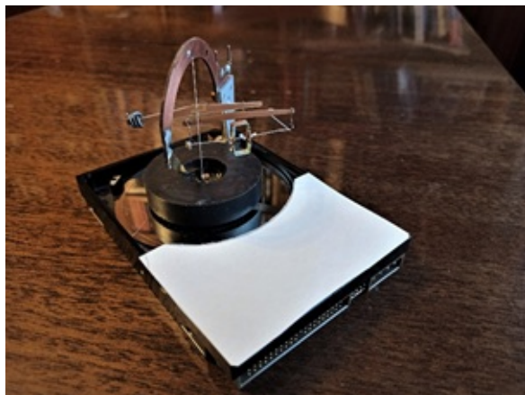
Фиг. 1. Установка с кольцевым магнитом и рамкой над полюсом магнита.

На установке виден кольцевой магнит, расположенный на подвижной платформе («винчестер» от ПК). Ось магнита совпадает с осью вращения. Над верхним полюсом магнита подвешена рамка из провода (катушка от микроамперметра). Рамка имеет две степени свободы: поворот вокруг вертикальной оси магнита и поворот вокруг горизонтальной оси над поверхностью полюса магнита.