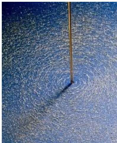
Фиг. 2. Картина распределения опилок при пропускании тока через провод.

Как можно заметить, почти все опилки в ближней к проводу зоне переместились на провод. Для них сила взаимодействия с током в проводе оказалась больше силы сцепления с картоном. На большем расстоянии отчётливо наблюдается группирование опилок в фрагментированные концентрические окружности относительно провода. Сила взаимодействия между опилками превышает силу сцепления с картоном даже на значительном расстоянии от провода с током.